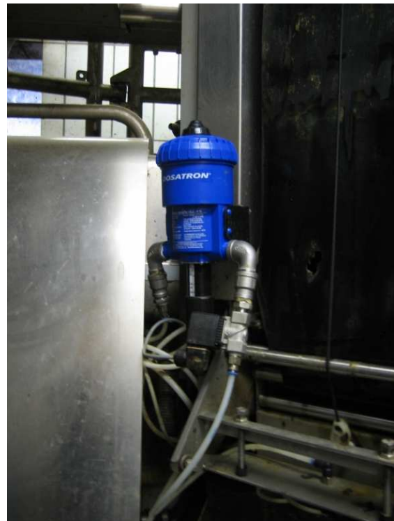
Peressigsäure-Dosierer zur Melkzeugzwischen-desinfektion

Bei Kühen, deren Zitzenabstand weniger als 0,5 cm zueinander beträgt, kann über eine längere Zwischenmelkzeit das Problem der Zitzen-Erkennung und damit das Ansetzen verbessert werden.