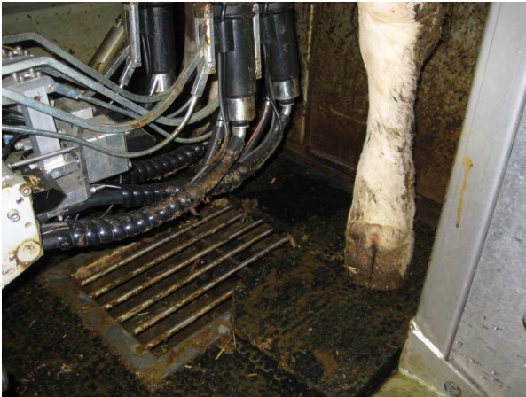
Westfalia Gummierhöhung

Bei allen Herstellern wird ein Mindestabstand der Sitzenspitzen zum Boden von mind. 27-30 cm benötigt, damit der Ansetzvorgang vorgenommen werden kann. Hier kann durch „Unterlegen“ von Gummimatten begrenzt Abhilfe geschaffen werden.