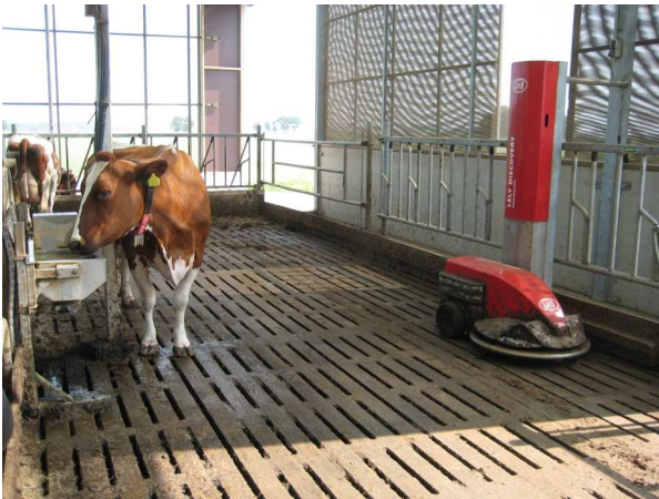
Spaltenschieber von Lely Discoverie

Zum Ausbruch kommt Mortellaro in der Regel im Zusammenhang mit Stressfaktoren, die die Immunität herabsetzen. Feuchtigkeit, sowohl auf der Lauf- und Standfläche führt zu erhöhtem Keimdruck. Hier können neben stationären Schieberanlagen auch automatische Spaltenreiniger Abhilfe schaffen.