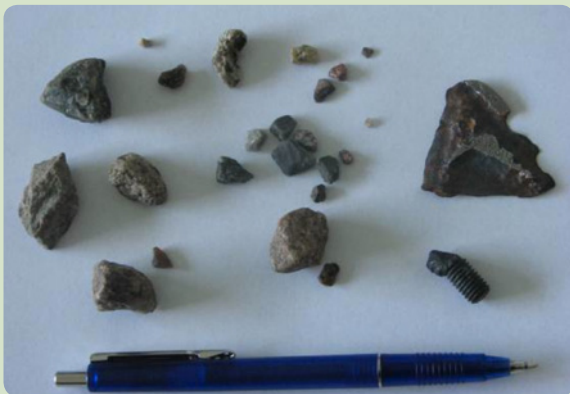
Was bei der Ernte noch mit eingefangen wird!

Durch die kräftigen Haubenkontraktionen können diese Fremdkörper durch die Wand gedrückt werden. Bauchfellentzündungen und Abszessbildungen in der Haube, Leber und Milz sind nur einige der möglichen Komplikationen, die dadurch entstehen können.