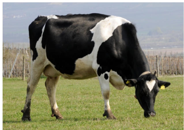
Hochleistungskühe haben einen sehr intensiven Stoffumsatz

Nacherwärmte Silagen bedeuten nicht nur deutlich größere und kostspielige Verluste, sondern mindern ganz empfindlich die Futterraufnahme der Kühe und können darüber hinaus auch – und das besonders bei hochleistenden Kühen in der Früh-laktation - gesundheitsschädlich (z.B. größeres Mastitisrisiko) wirken.