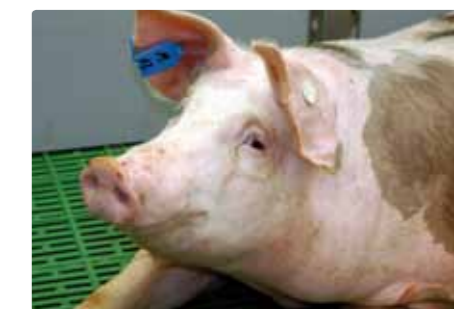
In der Anfangsmast wird Pflanzenöl mit bis zu 3 % zur Erhöhung des Energiegehaltes der Futtermischungen eingesetzt.

tigten Fettsäuren zu einem „weichen“ Speck, der sich nur bedingt für die Herstellung von Räucherwaren und luftgetrockneten Würsten eignet.