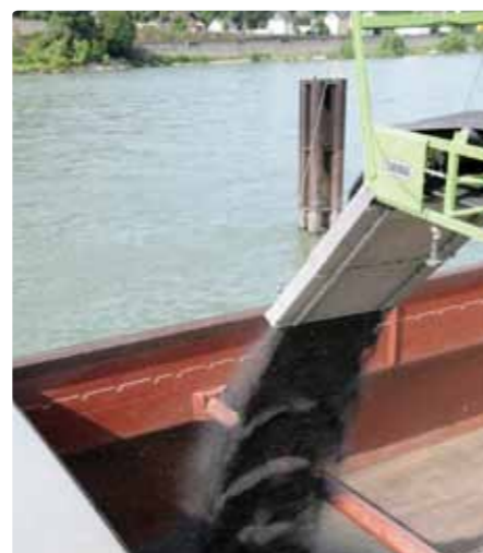
Aus Rapssaat kann hochwertiges Öl gewonnen werden.

Eine deutliche Reduktion der Staubbildung kann in mehligen Futtermischungen bereits durch Ölanteile ab 0,5% (optimal 1%) erreicht werden. Damit kann Veränderungen der Lungenfunktion der Tiere vorgebeugt werden, was sich in gesünderen Tieren und verbesserten tierischen Leistungen zeigt.