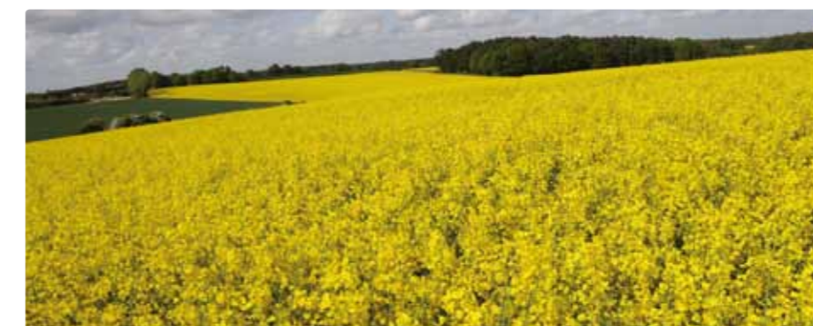
Beim Geflügel erfolgt der Öleinsatz vor allem zur Energieaufwertung. Dazu eignen sich vor allem Soja-, Raps- und Sonnenblumenöl, die zwischen 35 und 37 MJ ME je kg liefern und gleichzeitig hohe Anteile an Linol- und Linolensäure bereitstellen

Eigelb wieder, sodass hier bei Verwendung von Rapsöl oder auch geringen Mengen an Leinöl der Gehalt an der für die menschliche Ernährung günstigen α-Linolensäure erhöht werden kann. In der Broilermast wird durch den Ölzusatz eine höhere Energiekonzentration des Futters erreicht, was bei der noch begrenzten Futtermittelaufnahme der Küken die Ausschöpfung des hohen Wachstumspotentials ermöglicht.