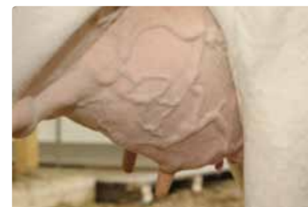
Mit zunehmender Leistung der Milchkuh steigt auch ihr Energiebedarf

Geschütztes Eiweiß – besonders für die Versorgung der Hochleistungskuh Mit zunehmenden Leistungen steigen die Forderungen an die Energie- und Eiweißversorgung. Dabei nimmt der Bedarf an nXP stärker zu als der Bedarf an NEL. Außerdem wird in den ersten Laktationswochen, wenn die Kühe ihre Körperreserven nutzen müssen, gerade der Eiweißbedarf oft nicht gedeckt. Körperfett liefert zwar Energie für die Kuh, aber keine Energie für die Bakterien und praktisch keine Eiweißbausteine für die Milcheiweißsynthese. Unter solchen Bedingungen fehlt mikrobielles Eiweiß. Wird der nXP-Mangel nicht durch unabgebautes Futterprotein