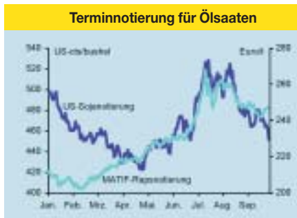
Terminnotierung für Ölsaaten