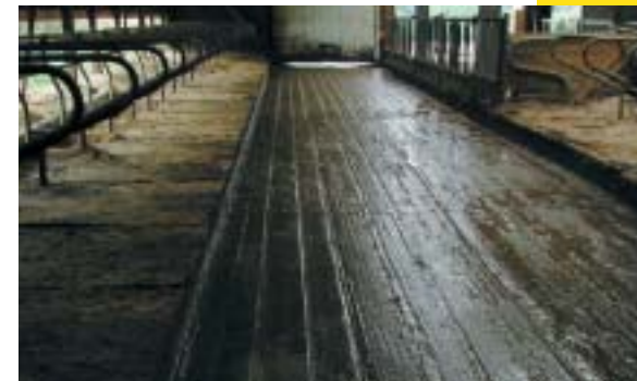
Die Längsrillen im Laufgang verbessern die Trittsicherheit für die Kühe erheblich

In den Rillen bleibt Jauche und dünner Kot zwar stehen, durch die raue Oberfläche der Rillen haben die Kühe trotzdem Halt. Bei dickerem Kot werden die Rillen durch die vom Schieber abgeschobenen Kothaufen freigeräumt.