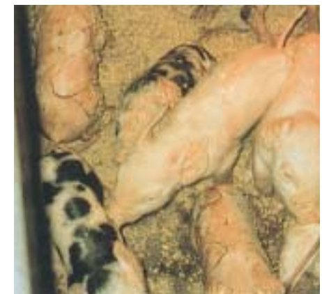
Das Krankheitsbild in der Abferkelbucht: lebensschwache Ferkel, reduzierte Wurfgrößen, mangelnde Milchleistung und Ausfluss bei den Sauen nach der Geburt

■ die Ferkel aus verschiedenen Herkünften zusammengestellt wurden,