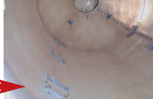
So sieht das Innenleben eines gereinigten und desinfizierten Silos aus

Eine hohe Feuchtigkeit im Vorratssilo begünstigt auch das Auftreten von Milben. Ein starker Milbenbefall ist am süßlichen Geruch und an der leicht rötlichen, sich bewegenden Staubschicht zu erkennen. Da sich Milben von kleinsten Partikeln ernähren, hat der Staubanteil im Futter eine große Bedeutung für ihre Entwicklung. Milben fördern den mikrobiellen Verderb des Futters, indem sie zum Beispiel höhere Feuchtegehalte verursachen.