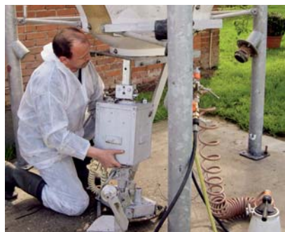
Hier wird das Gerät für ein neu entwickeltes Reinigungssystem aufgestellt

Sauen brauchen besonders in der Säugezeit eine hohe Futteraufnahme, damit sie nicht zuviel an Gewicht verlieren. Sie sollen 6 bis 7 kg pro Tag fressen. Das ist nur möglich, wenn das Futter in einem guten Frischzustand ist. Für die Ferkelaufzucht und die Schweinemast gilt der gleiche Grundsatz: nur schmackhaftes Futter wird gerne gefressen.