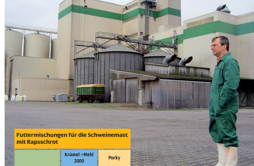
Futtermischungen für die Schweinemast mit Rapsschrot

Wulfa-Mast GmbH & Co. KG Mühlenstraße 4 49413 Dinklage Tel: 0 44 43-8 98-0 Fax: 0 44 43-8 98-66 E-mail: info@wulfamast.de www.wulfamast.de